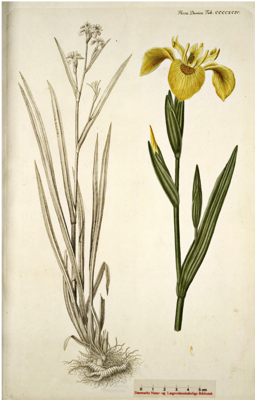
Flora Danica: Iris siberica , 1770. Findes også vildtvoksende i Gjerrild, og findes også i Læringslunden.