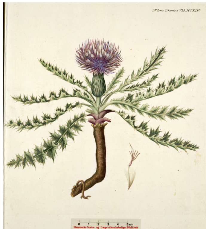
Lav tidsel/ Cirsium acaule Scop. Flora Danica, 1794.